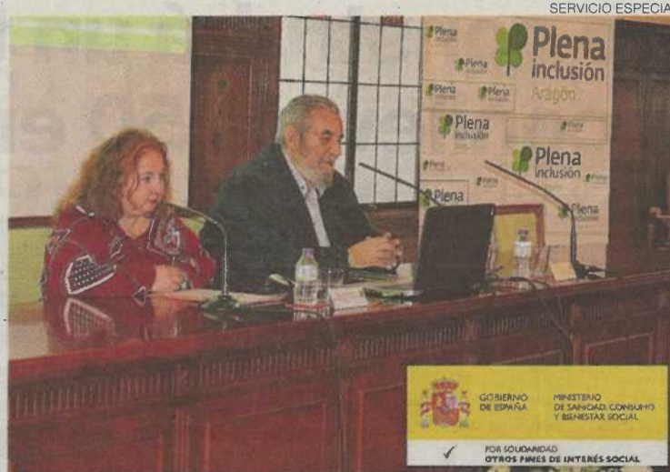
►► Charla de Plena inclusión Aragón en el Colegio de Abogados de Zaragoza.

Para las personas con discapacidad intelectual, es muy impor-