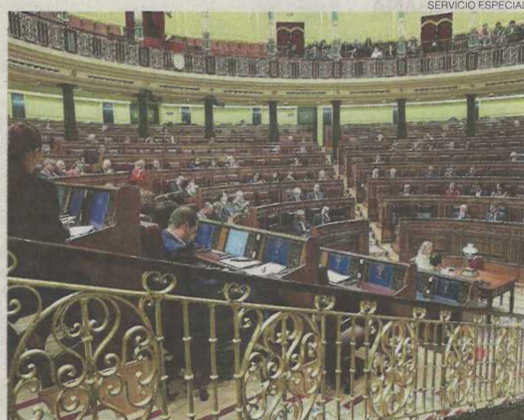
▶▶ El Congreso de los Diputados empieza hoy una reforma del Código Penal.

La proposición de ley fue presentada en el Senado por el grupo de Ciudadanos en enero de este año, a partir de un texto de la Fundación Cermi Mujeres. Más adelante, la iniciativa fue aprobada en la Cámara Alta por una amplia mayoría de 247 votos a favor. Solamente votaron en contra dos de los tres senadores de Vox, mien-