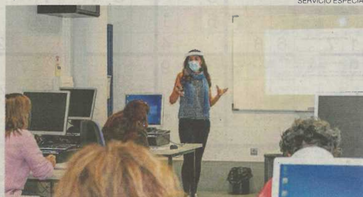
▶▶ Aula de formación de Fundación DFA.

Septiembre es el mes de la formación por excelencia ya que, después del verano, muchas personas se proponen continuar con su formación. Mejorar nuestra empleabilidad, aumentar el saber sobre un tema, reciclar conocimientos en un ámbito determinado o simplemente por el gusto de aprender. Sea cual sea el motivo que nos lleva a apuntarnos a un curso, ahora es el momento. Desde los Centros de Formación de la Fundación DFA se quiere fomentar la empleabilidad de las personas, ya